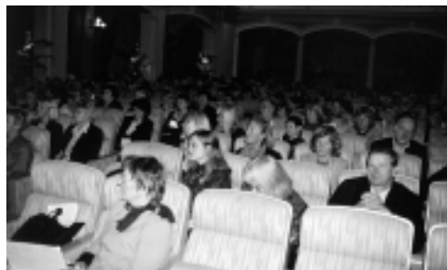
Seminariedeltagare tisdag 12 oktober